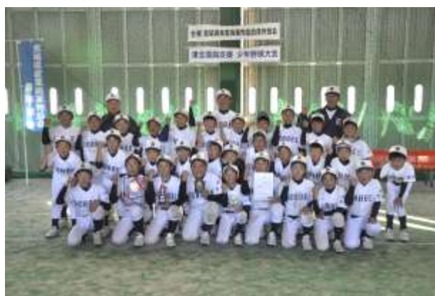
優勝チーム 六郷エコーズ