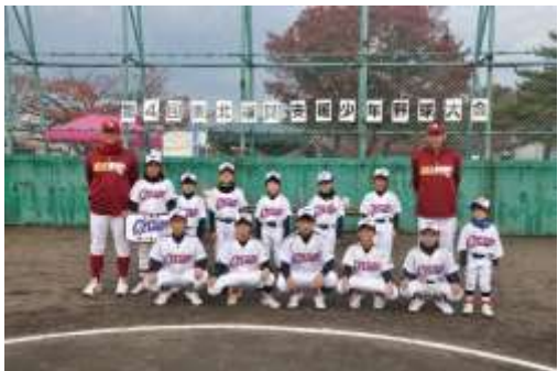
⑦サイクロンB. B. C