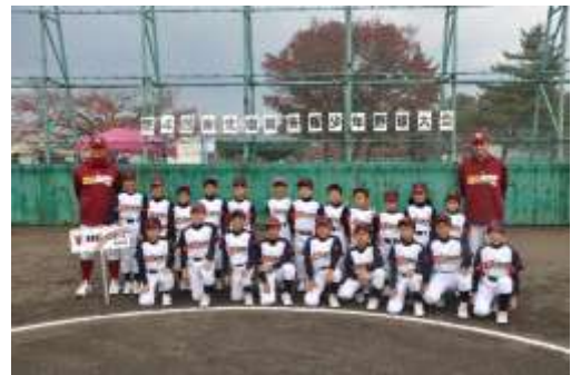
⑧多賀城レインボーズ