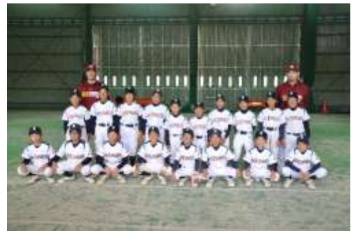
⑥色麻小あたごクラブ