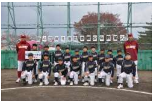
③山王小ファイターズ