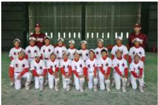
⑤荒巻少年野球クラブ